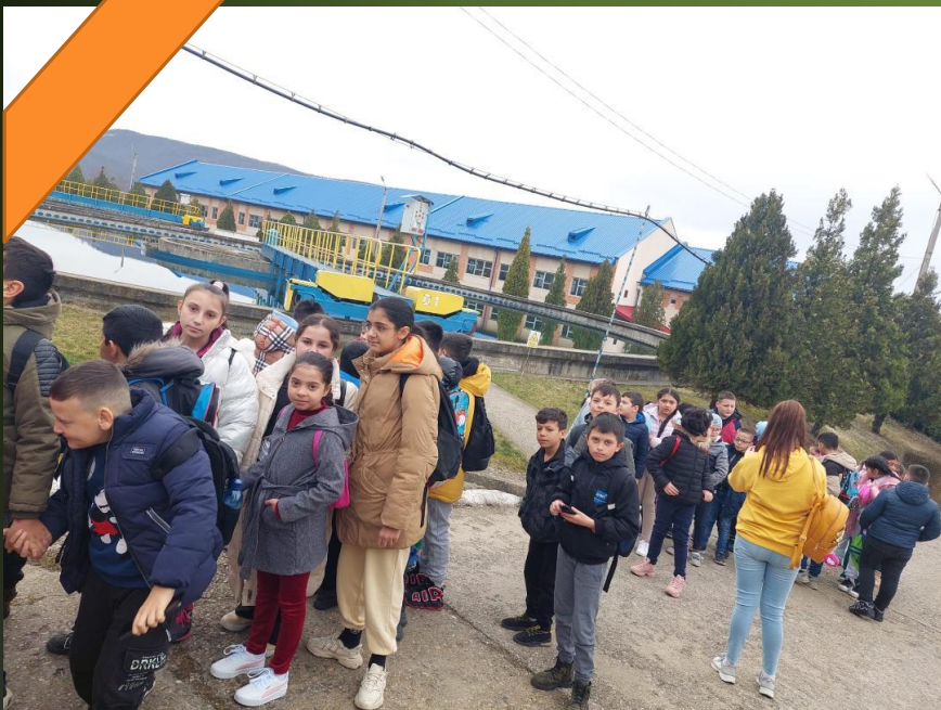
Plimbare la Uzina de apă, Sebeșel , " Apa potabila- sursa vitala" !!!