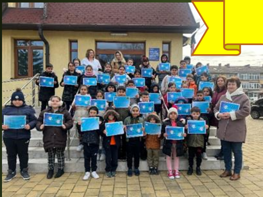
Un zâmbet frumos pentru fiecare