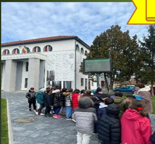
Importanța aerului în calitatea vieții – La plimbare