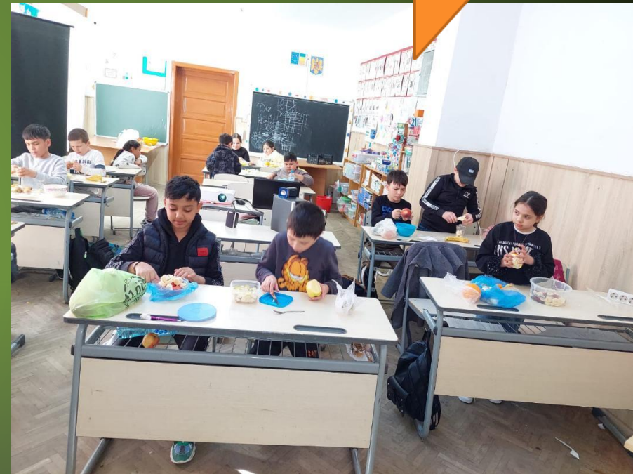
Mâncăm sănătos!-salata cu fructe