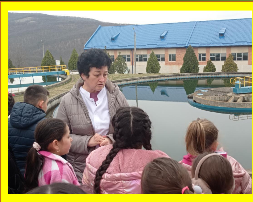
Excursie la Sebeșel, la Stația de Epurare a Apei;