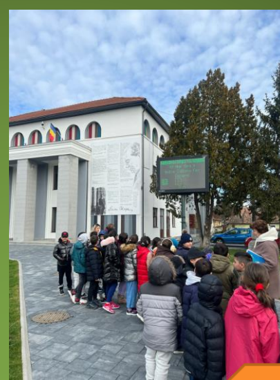
Apa și aerul