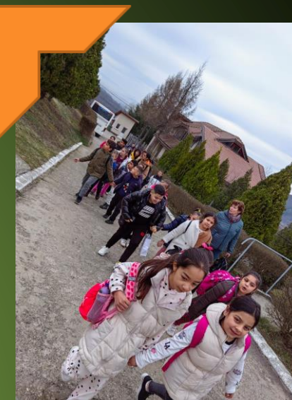
Copiii, prietenii naturii