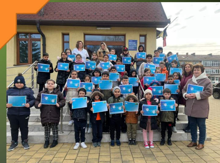
Un zâmbet frumos pentru fiecare