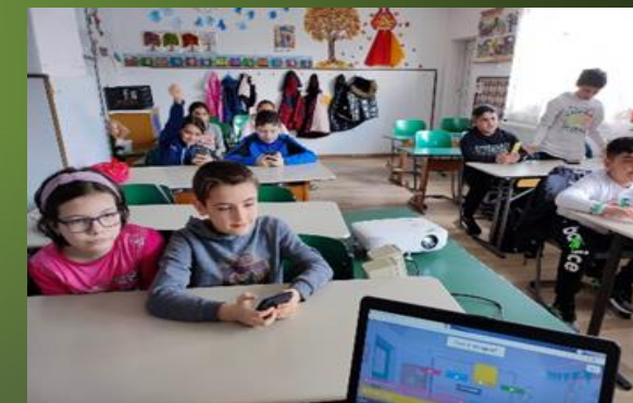
Minunata lume a plantelor și animalelor