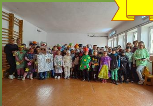
Copiii, prietenii naturii!