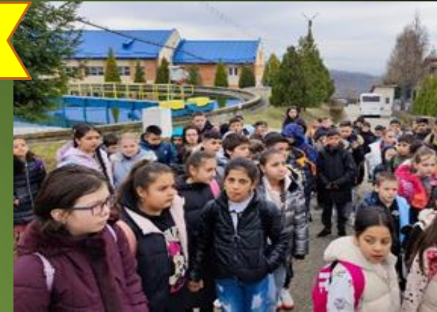
Apa – resursă vitală pentru existența umană