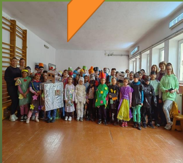
" Copiii, prietenii naturii ! "