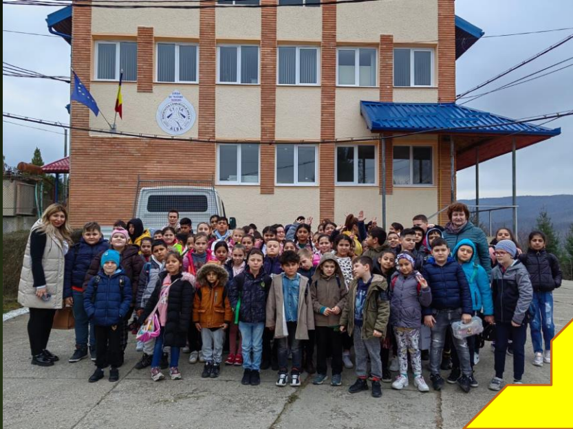
Apa, resursa vitală