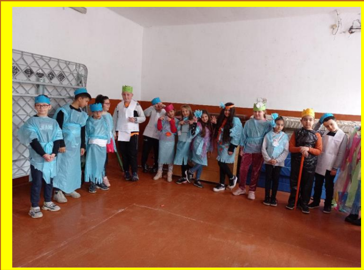
Costume ECO, confecționare și parada cu premiere